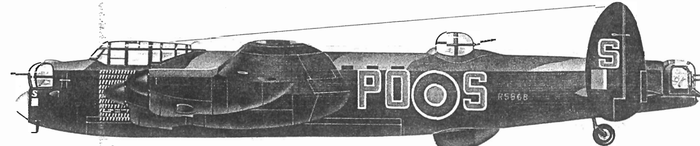
Avro Lancaster B.1 (Flugzeug der 467 Sqn., die von Waddington eingesetzt wurde und mit 137 Kampfeinsätzen die zweithöchste Gesamtleistung aller »Schweren« der RAF erzielte.)